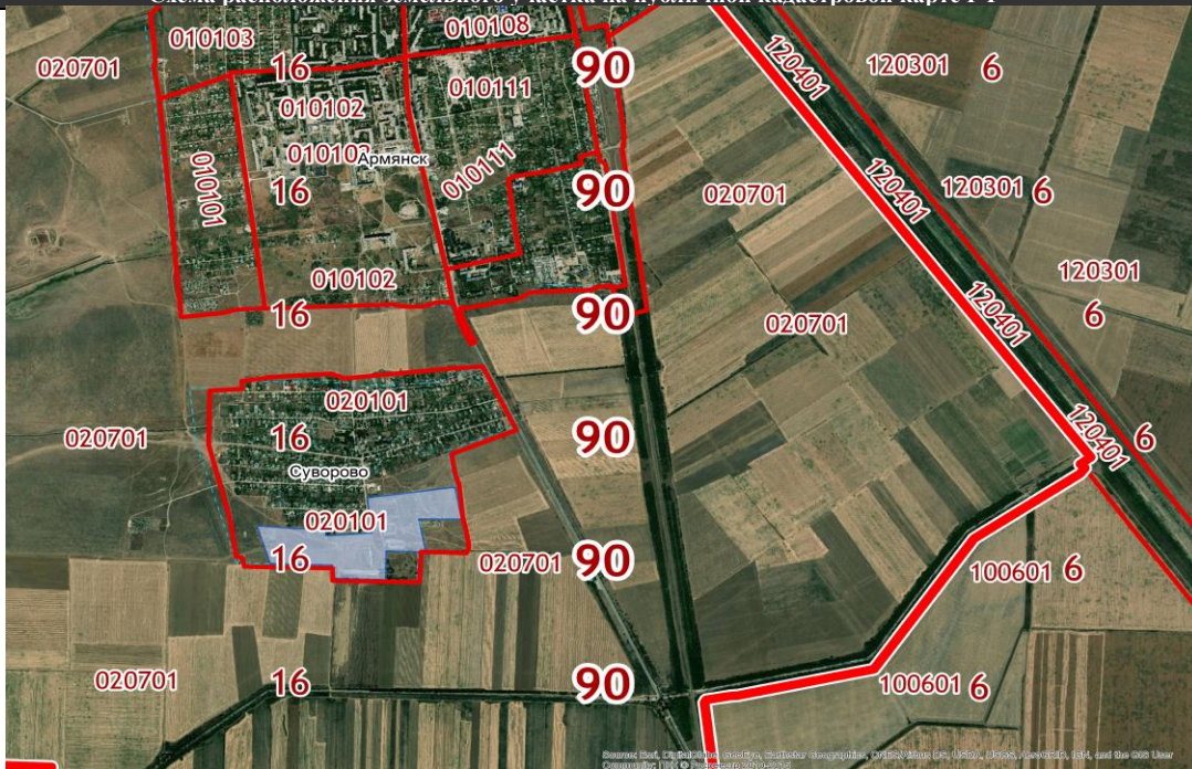
Схема расположения земельного участка на публичной кадастровой карте РФ